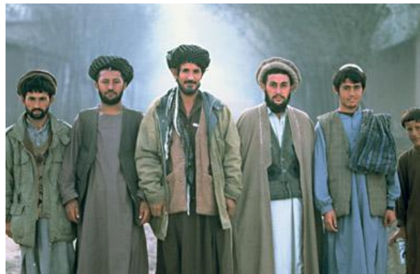
تصویر ۴ : باشندگان تاجیک در دره های بدخشان.