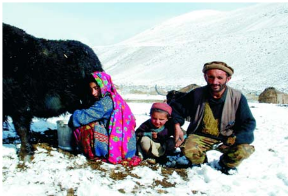
تصویر ۵ : باشندگان قرغز در کوهستان های پامیر [۵].

تعداد محدودی از هم میهنان ترکمن، پشتون و غرجهستانی هم در بدخشان می‌زیند مثلاً غرجهستانیها در منطقه "هزاره شیوه" ساکن اند. در مناطق دور شرق بدخشان در بلندی های پامیر قرغز ها سکونت می‌کنند (تصویر ۵).