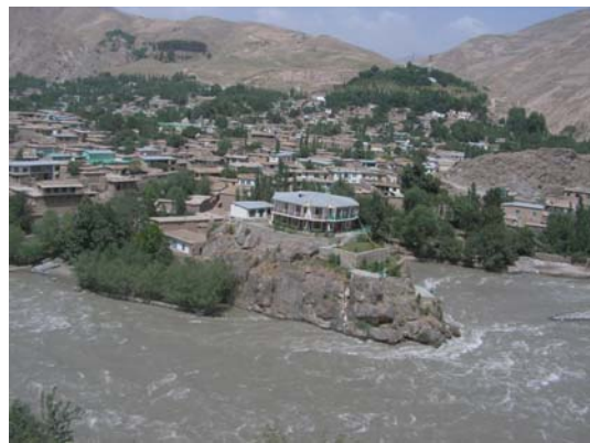
شیمای ۱ : ولایت بدخشان با ولسوالی های مربوط آن. شیمای از نگارنده.