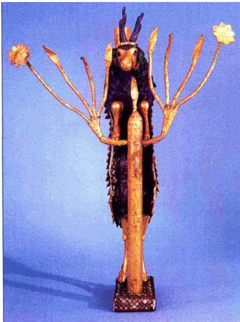
تصویر ۲: بز کوهی طلایی که شاخ ها و یال های آن از لاجورد افغانی ساخته و از بابل قدیم یافت شده و مطابق معتقدات سامری ها بر درخت زندگی که از طلا می باشد، بالا شده. قدمت: ۲۵۰۰ سال قبل از میلاد [۳، ص ۳۲].

به هر حال، احوال تاریخی بدخشان تا حدود زیادی از اوضاع جغرافیایی آن تأثیر گرفته و تحت آن رشد و انکشاف نموده است. زیرا بدخشان از زمانه های دور در چهار سوق مناطق پیشرفته مدنیت های کهن تاریخی موقعیت داشته و با این مناطق در داد و ستد تجارتي و فرهنگی بوده است. چنانکه کانون های متمدن مثل مناطق بین "سردریا" و "آمو دریا"، یا به قول عرب سیحون و جیحون به طرف شمال، هند در جنوب، چین در شرق و باختر در غرب این ولایت قرار داشته و از طریق شبکه های مختلف مواصلاتی و تجارتي "راه ابریشم" نه تنها با همدیگر بلکه با مراکز مدنیت های دور تر چون بین النهرین و مصر در ارتباط بودند (تصاویر ۱ و ۲).